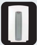
Calentadores de Agua Eléctricos Sin Tanque