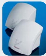
Galaxy™ Secadores de Manos Automáticos