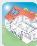
Energía Solar Térmica