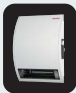
Calentadores Eléctricos de Ambiente