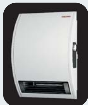
Calentadores Eléctricos de Ambiente