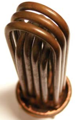
Resistencia de Cobre Exclusiva de Stiebel Eltron

* Unidad de uso múltiple - para servicio de 7.2 kW o 9.6 kW. Al instalar seleccione el servicio deseado. Seguir las instrucciones para hacer el empalme correcto.