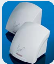
Galaxy™ Secadores de Manos Automáticos