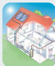
Energía Solar Térmica