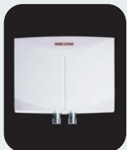
Calentadores de Agua Eléctricos Sin Tanque